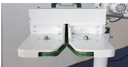
MANDIBULAS ABIERTAS PARA ALIMENTACION AUTOMATICA

LA MAQUINA PUEDE CONFIGURARSE CON DIVERSOS ACCESORIOS Y ADAPTACIONES: