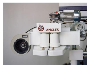
RECORTADOR DE BOLSAS