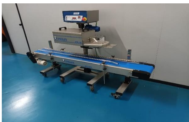
VERSION ACERO INOXIDABLE