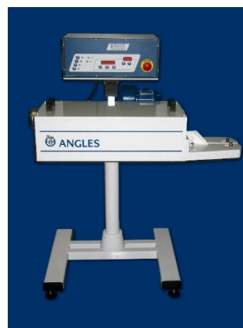
CABEZAL SIN CINTA TRANSPORTADORA